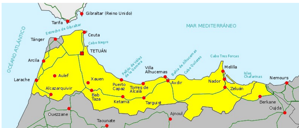
Protectorado español en Marruecos 1912-1955

Los intentos de las potencias de entrar en Marruecos llevaron a la Conferencia de Algeciras en 1906, que concedió a Francia y España una zona de influencia sobre el sultanato de Marruecos. Crisis internas que el sultán no pudo resolver así como la ingerencia de Alemania en la zona llevaron a que Marruecos se convirtiera en protectorado de Francia y de España a partir de 1912.