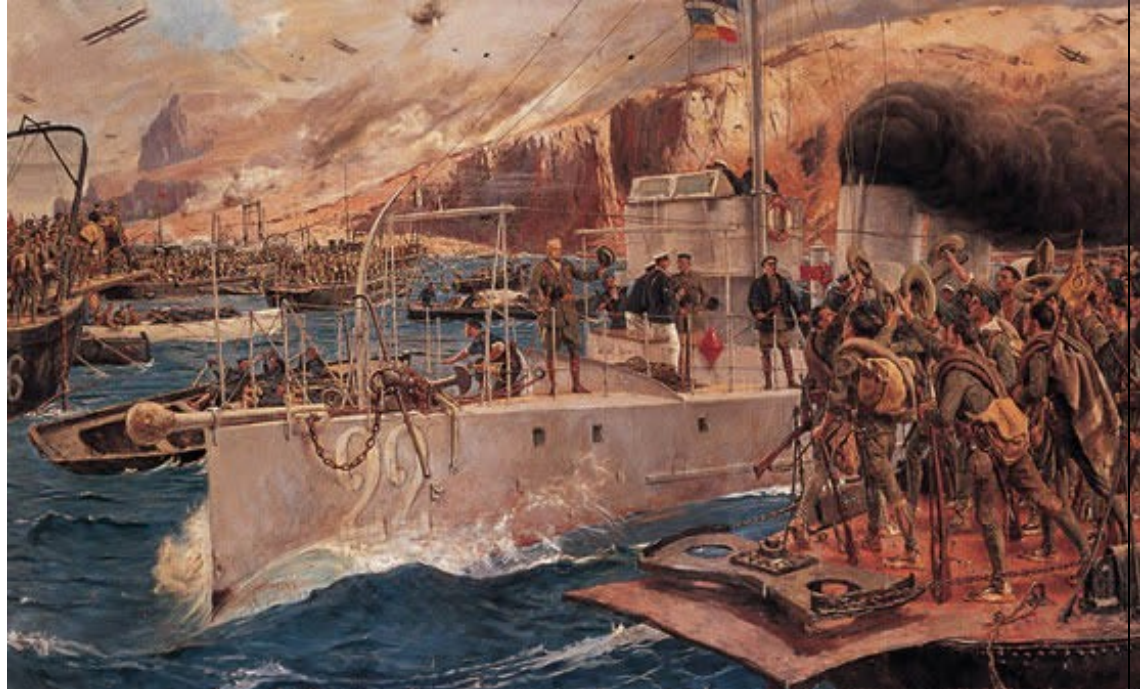
Pintura alegórica del Desembarco de Ahucemas, en primer término el General Primo de Rivera.

En 1925 un contingente franco-español desarrolla en la bahía de Alhucemas, la primera acción aeronaval de la historia militar, AbdelKrim se entrega a los franceses y el territorio se pacifica poniendo fin a la Guerra de África.