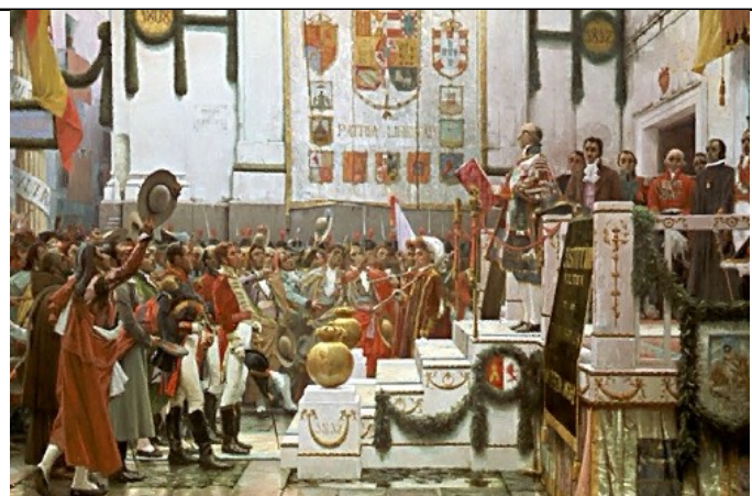
Cortes de Cádiz