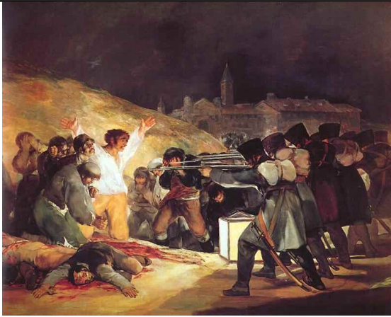
Goya - Fusilamientos del 3 de mayo