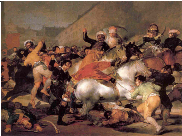
Goya – Carga de los Mamelucos

Mientras se desarrollaban los hechos de Bayona, se inició en España el levantamiento popular. El 2 de mayo el pueblo de Madrid se alzó de forma espontánea contra la presencia francesa. Fue duramente reprimido por el ejército francés, pero el ejemplo cundió por todo el país y la población se levantó contra el invasor en un movimiento de resistencia popular