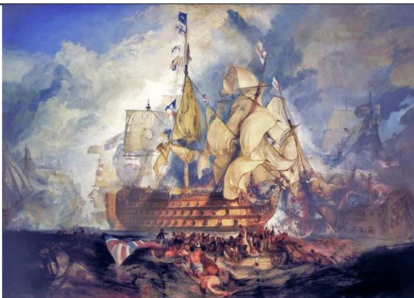
Batalla de Trafalgar 1805