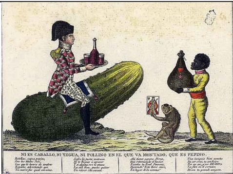
Jose I Pepe Botella

Las instituciones del Antiguo Régimen: Consejo de Castilla, Secretarías, Capitanías Generales, no estuvieron a la altura de las circunstancias, y sin declararse plenamente leales al rey José I, tampoco se proclamaron en rebelión contra los franceses, por lo que surgió un vacío de poder que va a ser ocupado por las Juntas, primero locales, luego provinciales que forzaron la reunión de una Junta General Central que asumiera la soberanía y organizase la resistencia frente al invasor.