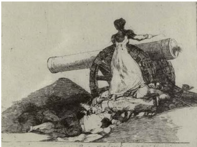
Goya- Agustina de Aragón

ejército regular que armaron a los habitantes, siendo sitiados por los ejércitos franceses. Fueron los llamados “ los sitios ” de Gerona (defendida por el General Álvarez de Castro) o Zaragoza , (defendida por el General Palafox, con la singular participación de la heroína popular Catalina de Aragón ) que desgastaban al ejército francés y daban tiempo a la organización de la resistencia en el resto del país.