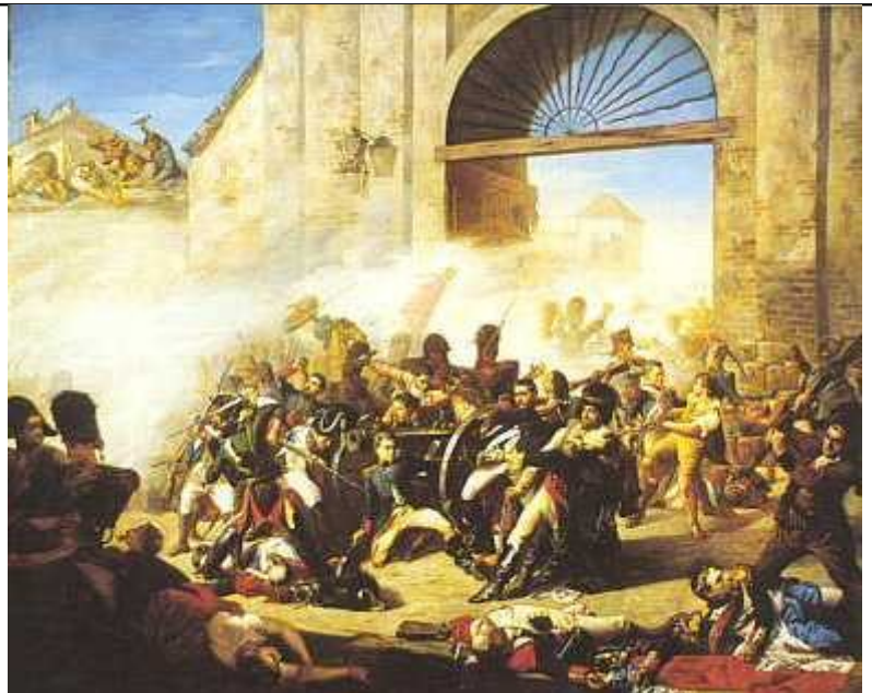
Muerte de Daoiz y Velarde en el Parque de Monteleón