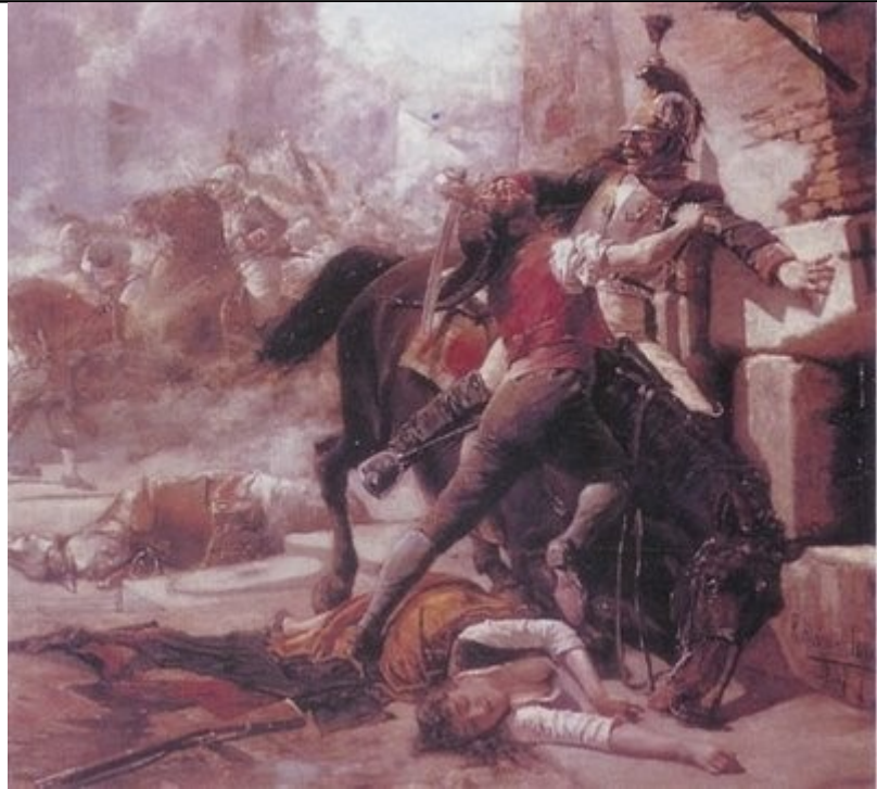
Héroes del 2 de mayo: Manuela Malasaña