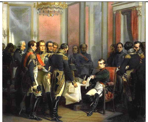
Tratado Fontainebleau 1807